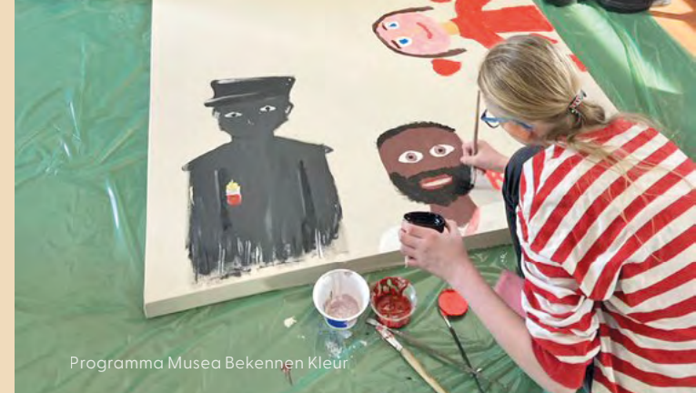
Programma Musea Bekennen Kleur