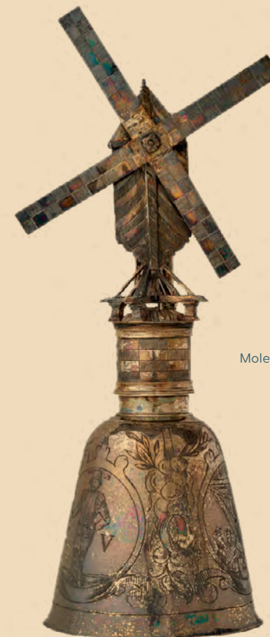
Molenbeker, 17e eeuw

In opdracht van Stichting Behoud Scheldecollecties is de collectie van de Koninklijke Schelde Groep geïnventariseerd en gefotografeerd. Deze