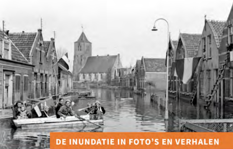
DE INUNDATIE IN FOTO'S EN VERHALEN