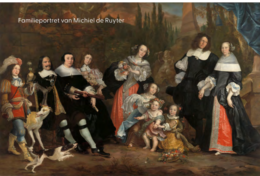
Familieportret van Michiel de Ruyter

Toch kijkt het muZEEum positief terug op 2022. In bezoekersaantallen heeft het muZEEum zeker weer de weg omhoog gevonden. De herinrichting is - na vier voorbereidingsjaren - eindelijk van start gegaan. En het muZEEum is erin geslaagd het jaar financieel positief af te sluiten.